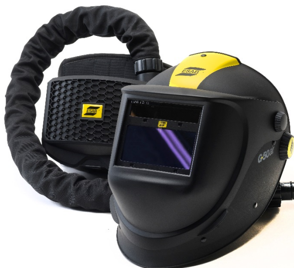
G50 Air s jednotkou ESAB PAPP